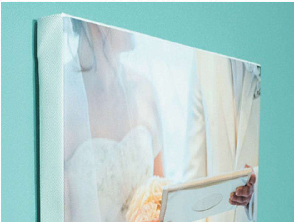
(2)表面のみ印刷で若干のずれが生じた場合