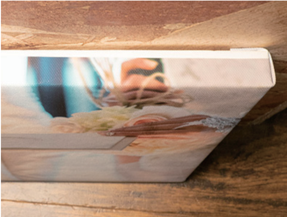
(1)塗り足しが足りず、用紙の白場が側面に生じた場合